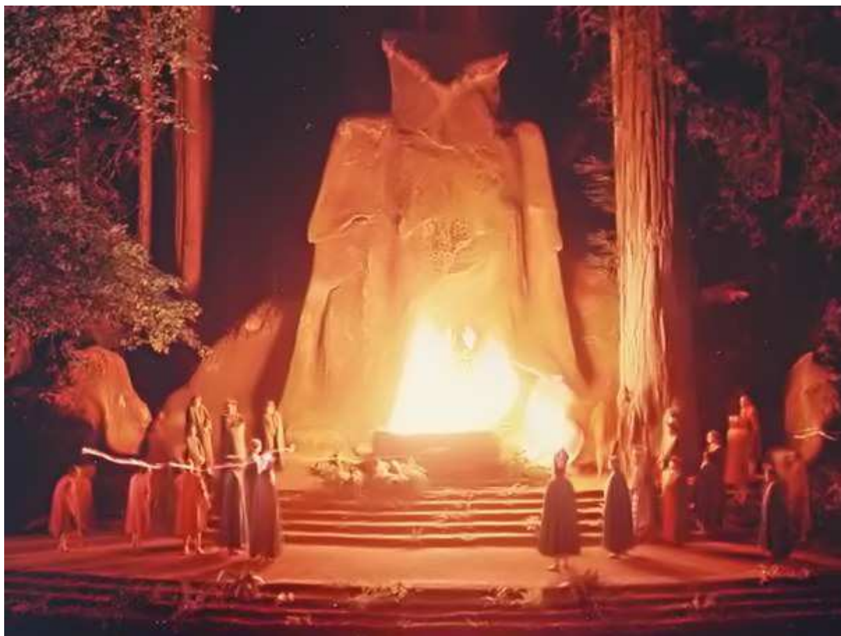
The Bohemian Grove

Wer sich näher mit den elitären Clans und den herrschenden Häusern beschäftigt, wird sehen, dass diese in so ziemlich allen wichtigen westlichen Machtpositionen sitzen. Sie haben die Macht und das Geld. Sie treffen sich in geheimen Klubs und entscheiden über die Zukunft unserer Erde.